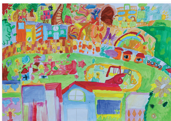
岩 本 涼 楓