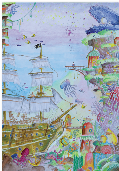
大 谷 歩 夢