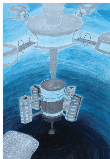
本 間 日 向