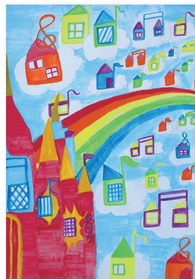
森 和 香 菜

山の上から街を見ているイメージで描きました。自然豊かで活気のある福井の街を考えながら描きました。