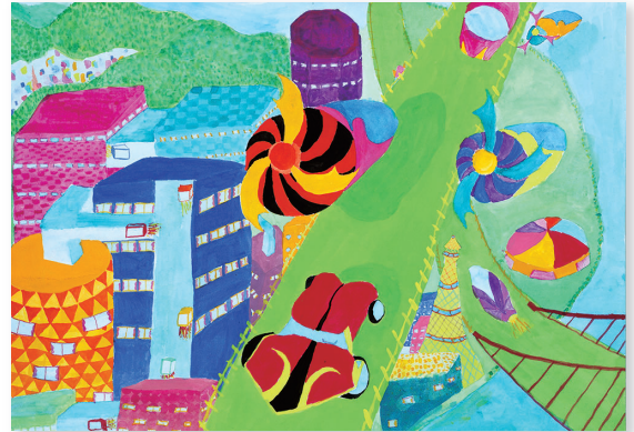
法邑 未来 福井の未来の創造の街を描きました。緑あふれる自然の豊かさを残し、動物も人間も環境にも良い街を目指しました。中央に浮いている乗物は自然エネルギーの風を利用し、行きたい場所へ車のように自由自在に動かせます。そして、道路は芝でできていて熱をためずに涼しいです。また、車は少し浮いて走るため芝もずっと綺麗です。ビルでは一つ一つの会社が情報を共有して福井が発展していけるよう全てのビルと超高速エレベーターがつながっています。