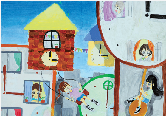
矢部 陽夏 もしも、時計に人が住んでいたら面白いと思って描きました。人が時計のふりこの部分につかまって遊んでいたりと、部屋で寝ていたり、窓の外を眺めていたりとそれぞれ違うことをしているようにしました。特に、レンガの部分には上と下の色が同じにならなくすることが難しかったです。